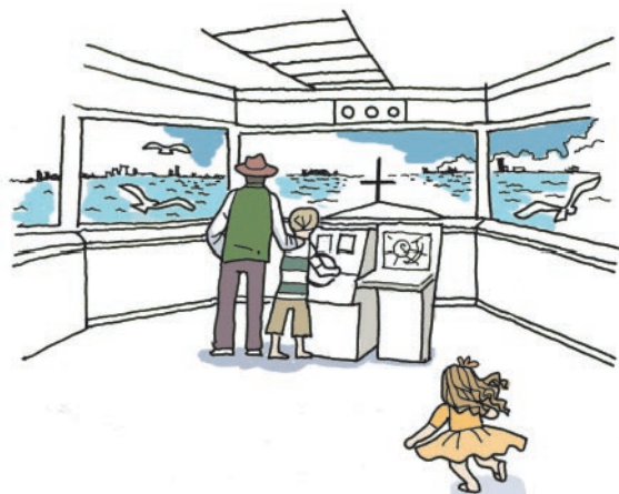
横浜みなと博物館